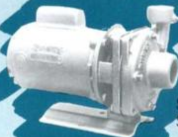
SERIE G5 SERIE G6